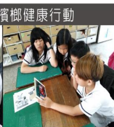
觀看雲遊學 任務示範說明