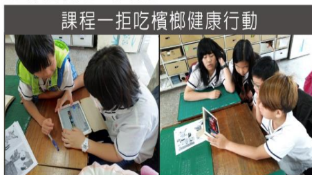
上網搜尋 營隊歌資料