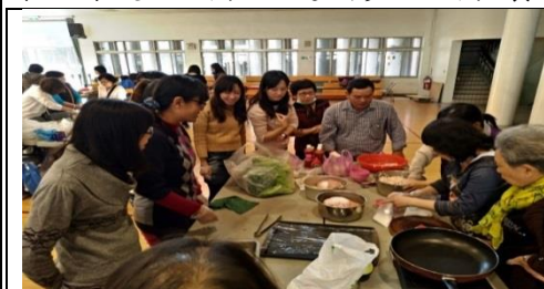
▲東亞南飲食專家到校指導

本校本位創新課程為世界飲食文化，為提升教師專業知能，特別安排東南亞食育研習現場除了介紹東南亞食物英語外，並透過動手實作牛肉河粉、春捲等越南美食，達到多重美食饗宴之功效。