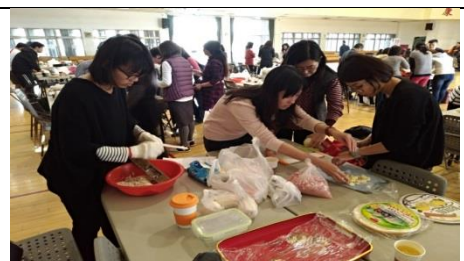
▲教師動手製作東南亞料理