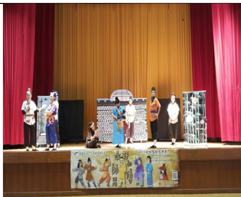
活動名稱：全校性閱讀戲劇展演 辦理時間：106年12月