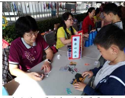
活動名稱：園遊會:閱讀闖關活動 辦理時間：107年3月28日