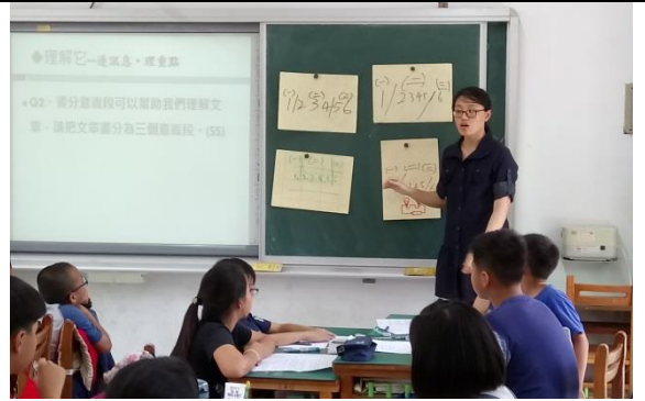
編號：04 日期：107.4.11 文字說明：說課、觀課及議課(1)