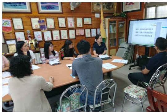
編號：05 日期：107.5.2 文字說明：閱讀教學分享