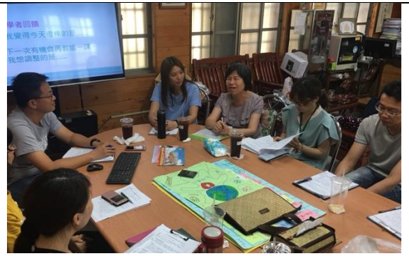
編號：06 日期：107.5.30 文字說明：說課、觀課及議課(2)