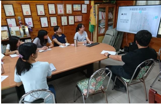
編號：03 日期：107.3.28 文字說明：TASA 評量準備與教學分享