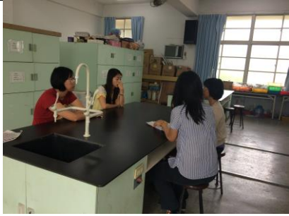
編號:03 說明:社群成員議課