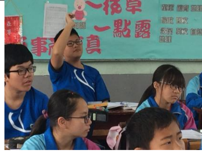
編號:06 說明:學生閱讀課發表想法