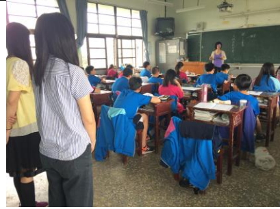
編號:04 說明:閱讀課觀課