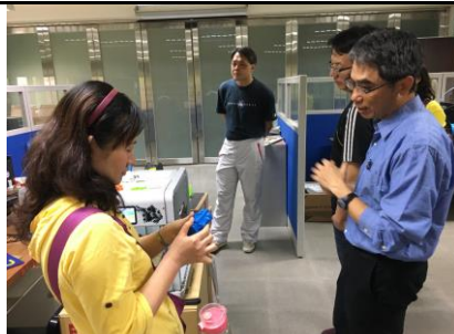
編號：02 日期：107.03.14 文字說明：參訪南榮科技大 學創克基地