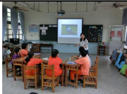
編號：07 日期：107.03.31 文字說明：觀課-融入英語領 域