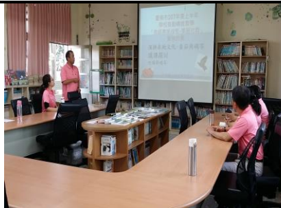
編號：08 日期：107.04.11 文字說明：公開觀課後之議 課