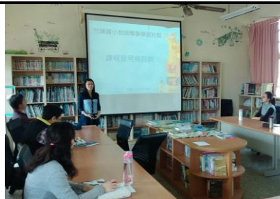
編號：03 日期：107.03.21 文字說明：課程發展與設計 研討