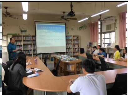
編號：04 日期：107.03.30 文字說明：備課-觀課前會談