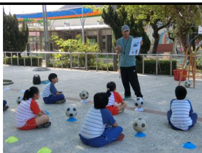
編號：06 日期：107.03.31 文字說明：觀課-融入健體領 域