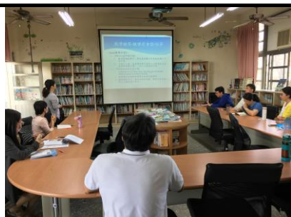
編號：05 日期：107.03.30 文字說明：備課-觀課前會談