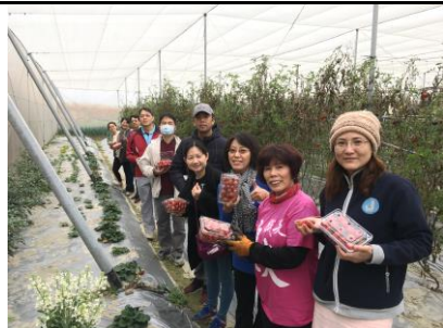
編號：01 日期：107.03.07 文字說明：參訪番茄達人的 番茄園