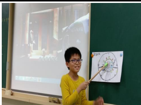
編號：03 日期：107.04.27 文字說明：影片欣賞課程活動