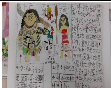
編號：04 日期：107.04.27 文字說明：學生學習心得