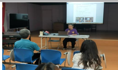
編號：07 日期：107.05.16 文字說明：課程實施成果分享