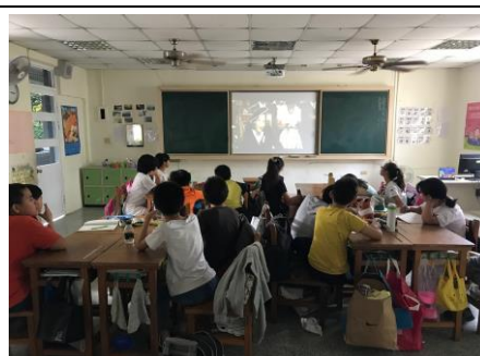
編號：06 日期：107.04.24 文字說明：五年級課程活動