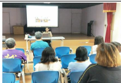
編號：08 日期：107.05.16 文字說明：課程實施成果分享