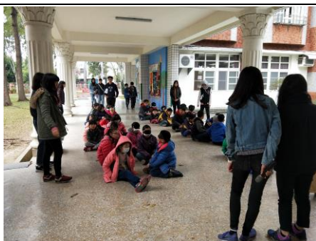
編號：05 日期：107.04.10 文字說明：四年級課程活動