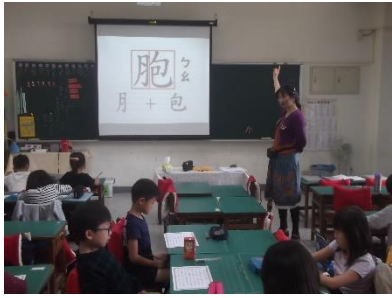
編號：03 日期：107.04.12 文字說明：社群成員進行公開授課。