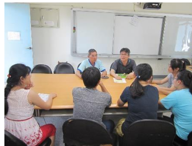
編號：05 日期：107.06.11 文字說明：社群伙伴進行「閱讀理解教學策略」實際教學後的分享。