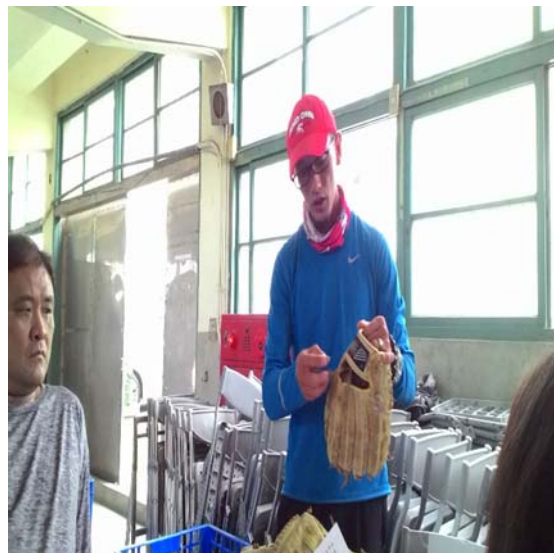
體育器材維護示範