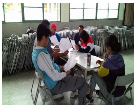
學生柔軟度的情形描述