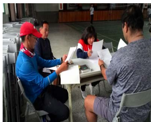
學生柔軟度的情形調查