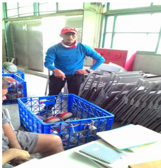
體育器材維護說明