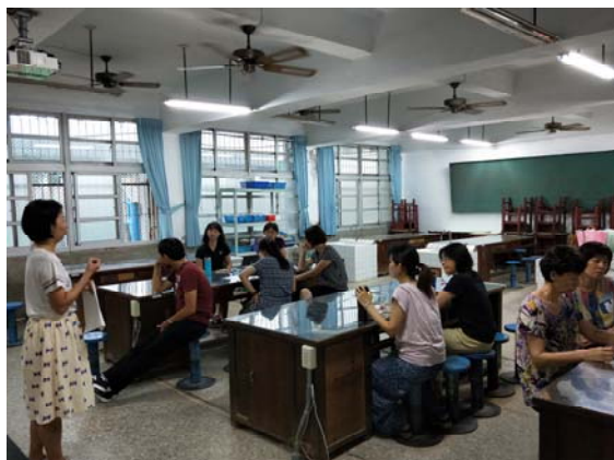
課程教材小組報告