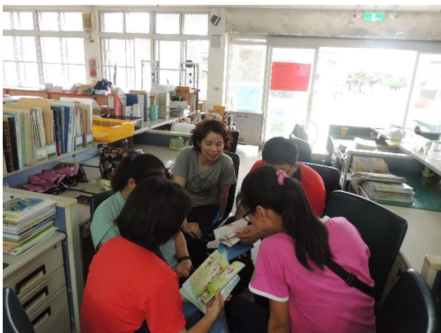
討論教學重點要放在哪裡