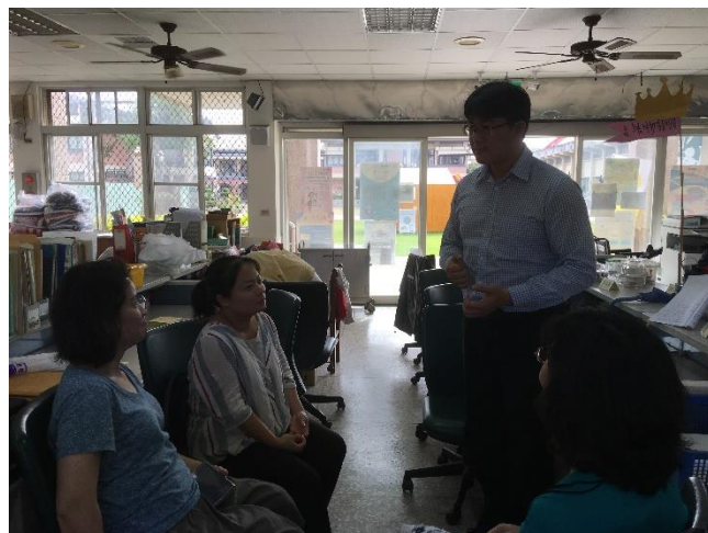
繪本教學融入健體