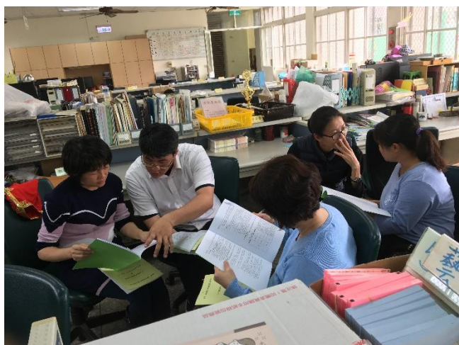
研讀十二年國教健康與體育領域課程綱要