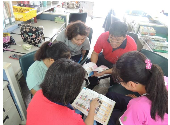
討論如何引起學生興趣