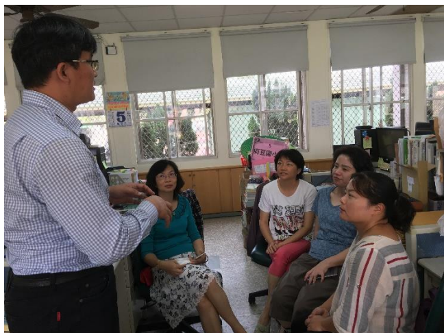
資訊教育融入健康