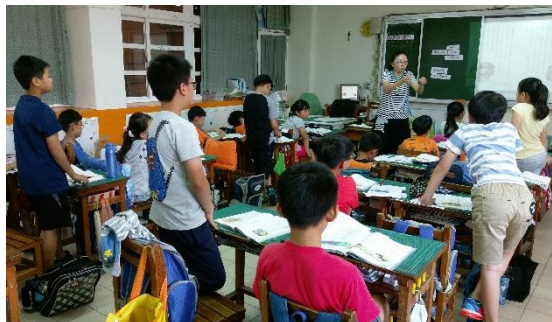
編號：04 日期：106.04.26 文字說明：社群召集人公開觀課