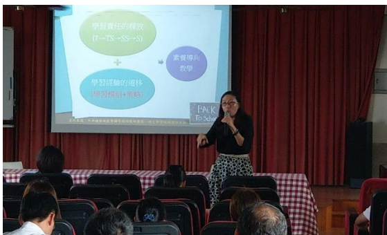
編號：03 日期：106.01.20 文字說明：國語輔導員專業知能講座