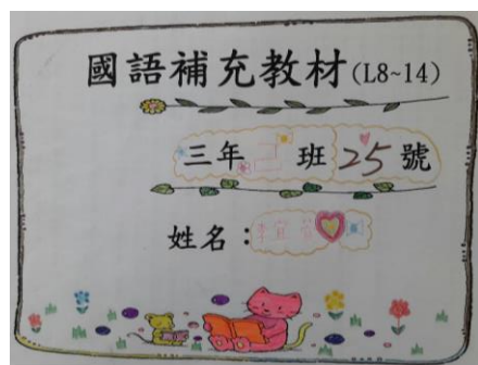
編號：08 日期：106.11.13 文字說明：國語課運用補充教材小組討論