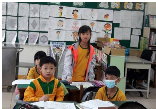
編號：06 日期：106.03.20 文字說明：國語課運用補充教材小組發表