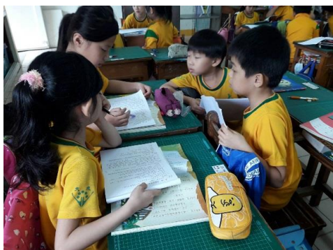
編號：05 日期：106.09.25 文字說明：國語課運用補充教材小組討論